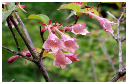
ベニバナツグバネウツギ