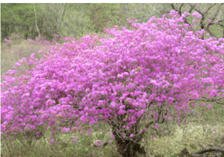
トウゴクミソバツツジ